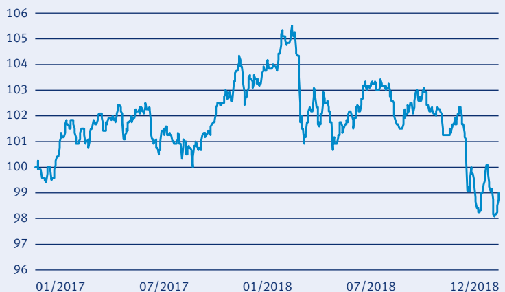
— STANDARD LIFE MyFolio Multi Manager Balance

Risiko: Die in der Vergangenheit erzielte Performance und die Ertrage lassen keinen Ruckschluss auf die zukunftige Performance und die Ertrage des Fonds zu. Der Fonds ist weder mit einer Garantie noch mit einem Kapitalschutzmechanismus ausgestattet. Der in Euro umgerechnete Wert internationaler Anlagen des Fonds kann infolge von Wechselkursschwankungen (Wahrungsschwankungen) sowohl steigen als auch sinken. Der Wert des Fonds und damit der Wert Ihres Investments kann gegenuber dem Einstandspreis steigen oder fallen.