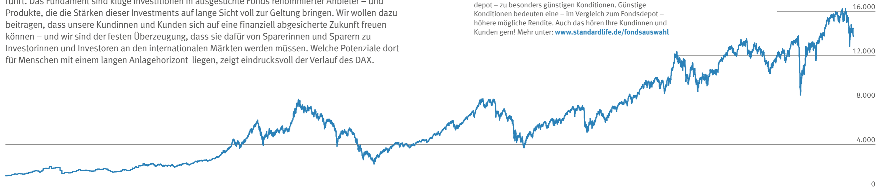
Verlauf des DAX 1988 – 2022*

Rendite macht glücklich. Sie lässt sich im Laufe der Zeit in vieles ummünzen: in Luxus, gutes Essen, eine neue Uhr, ein neues Auto. Wenn wir von Standard Life uns auf Rendite fokussieren, geht es uns aber in erster Linie um die langfristige materielle Sicherheit unserer Kundinnen und Kunden: Sicherheit macht nämlich noch glücklicher! Wir sind überzeugt davon, dass der beste Weg zu einer finanziell abgesicherten Zukunft – und einem auskömmlichen Ruhestand – über die internationalen Kapitalmärkte führt. Das Fundament sind kluge Investitionen in ausgesuchte Fonds renommierter Anbieter – und Produkte, die die Stärken dieser Investments auf lange Sicht voll zur Geltung bringen. Wir wollen dazu beitragen, dass unsere Kundinnen und Kunden sich auf eine finanziell abgesicherte Zukunft freuen können – und wir sind der festen Überzeugung, dass sie dafür von Sparerinnen und Sparern zu Investorinnen und Investoren an den internationalen Märkten werden müssen. Welche Potenziale dort für Menschen mit einem langen Anlagehorizont liegen, zeigt eindrucksvoll der Verlauf des DAX.